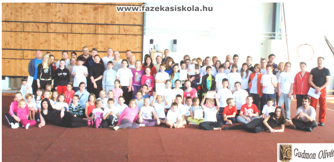
Családi Spornap a Fazekasban, 2014. december 13.