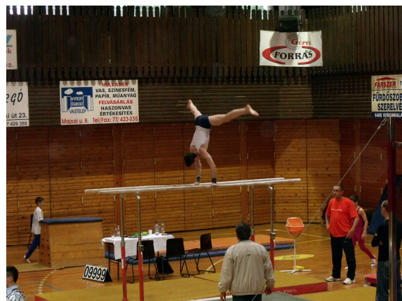
A fotó a DKMT-Kupa Nemzetközi Versenyen készült.